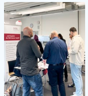
Jobmesse Quality United in Renningen