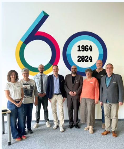
Das Team in Villingen